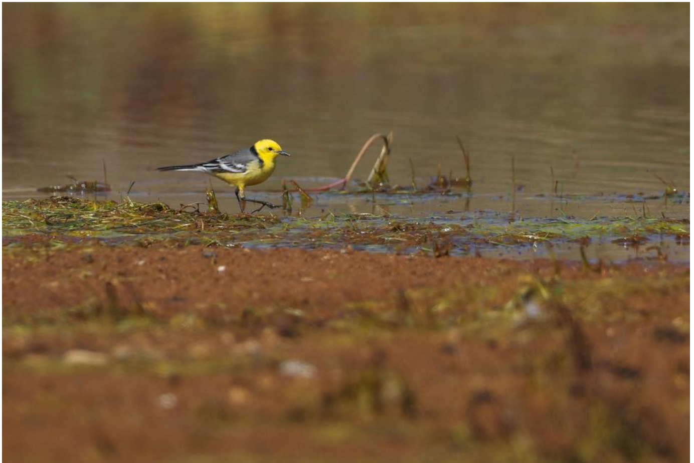
Citronvipstjert, Grønnestrand den 18. april 2019.

SU har på mødet den 6-7/3 2020 besluttet, at brilleand og citronvipstjert udgår fra SU-listen. DKU varetager dermed nu kvalitetssikringen af de to arter. DKU forventer god dokumentation for begge arter og i særdeleshed for fund af citronvipstjertes, i form af foto, lydoptagelse og/eller beskrivelse af både dragt og kald, hvis fuglen høres. Dette forventes, da både kaldet og dragten let kan forveksles med andre racer af gul vipstjert og østlig gul vipstjert.