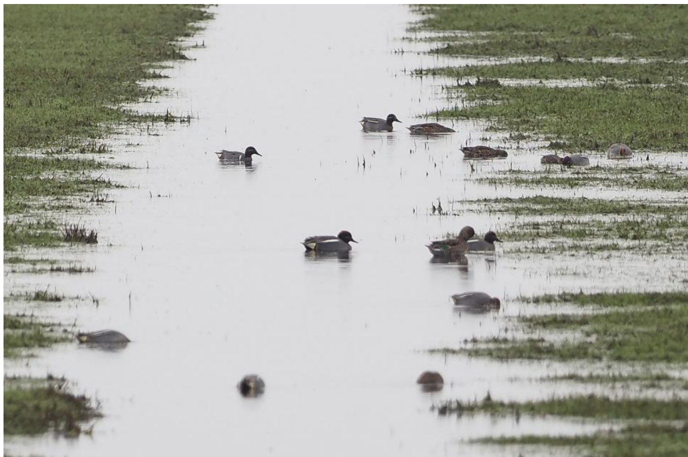
Amerikansk krikand, Bygholmengen, Vejlerne den 3. april 2019.

Lille stormsvale Kongederfugl Dværuggås Grønlandsk blisgås Lille skrigeørn Stribet ryle Damklire Middelhavssølvmåge Rødrygget svale Markpiber Sydlige nattergal Sibirisk gransanger Hvidhalset fluesnapper Rosenstær (især ungfugle) Hortulan