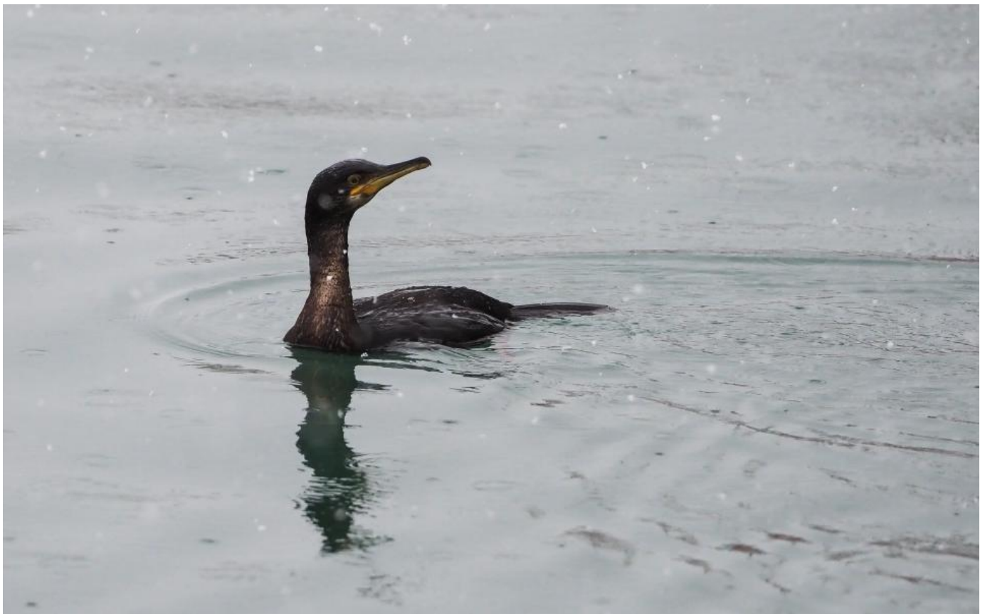
Topskarv, Hanstholm Havn den 29. januar 2019.

DKU har undersøgt vanskelighederne forbundet med bestemmelsen af trækkende dværggæs. Udvalget har rådført sig med norske og finske eksperter, og forhørt sig hos det skånske "DKU" – Rrk Skåne, om hvordan de sagsbehandler deres observationer af trækkende dværggæs. Arten kan være meget vanskelig at artsbestemme med sikkerhed i flugten, hvor de artskaraktistiske kendetegn i hovedet - herunder bred, gul øjenring og blissens udformning (hos adulte) - er meget svære eller umulige at se. Dværggåsens flugt-jizz adskiller sig fra blisgåsens, men DKU mener ikke, at arten bør anerkendes i DOFbasen på basis af jizz alene, da dette kan være vanskeligt at vurdere på afstand. Størrelsen overlapper i øvrigt så meget med blisgås, at den ikke har afgørende betydning. Dværggås bør dog stadig kunne artsbestemmes med sikkerhed i flugten, og dermed anerkendes i DOFbasen på basis af flere, velbeskrevne kendetegn og jizz ´et. DKU vil i den kommende tid kigge nærmere på fundene af trækkende dværggæs i DOFbasen og sætte de sager til behandling, hvor det vurderes, dokumentationen er mangelfuld. Vi håber i den forbindelse på forståelse for, at DKU tager nogle gamle sager op for at sikre, at data i DOFbasen er veldokumenterede.