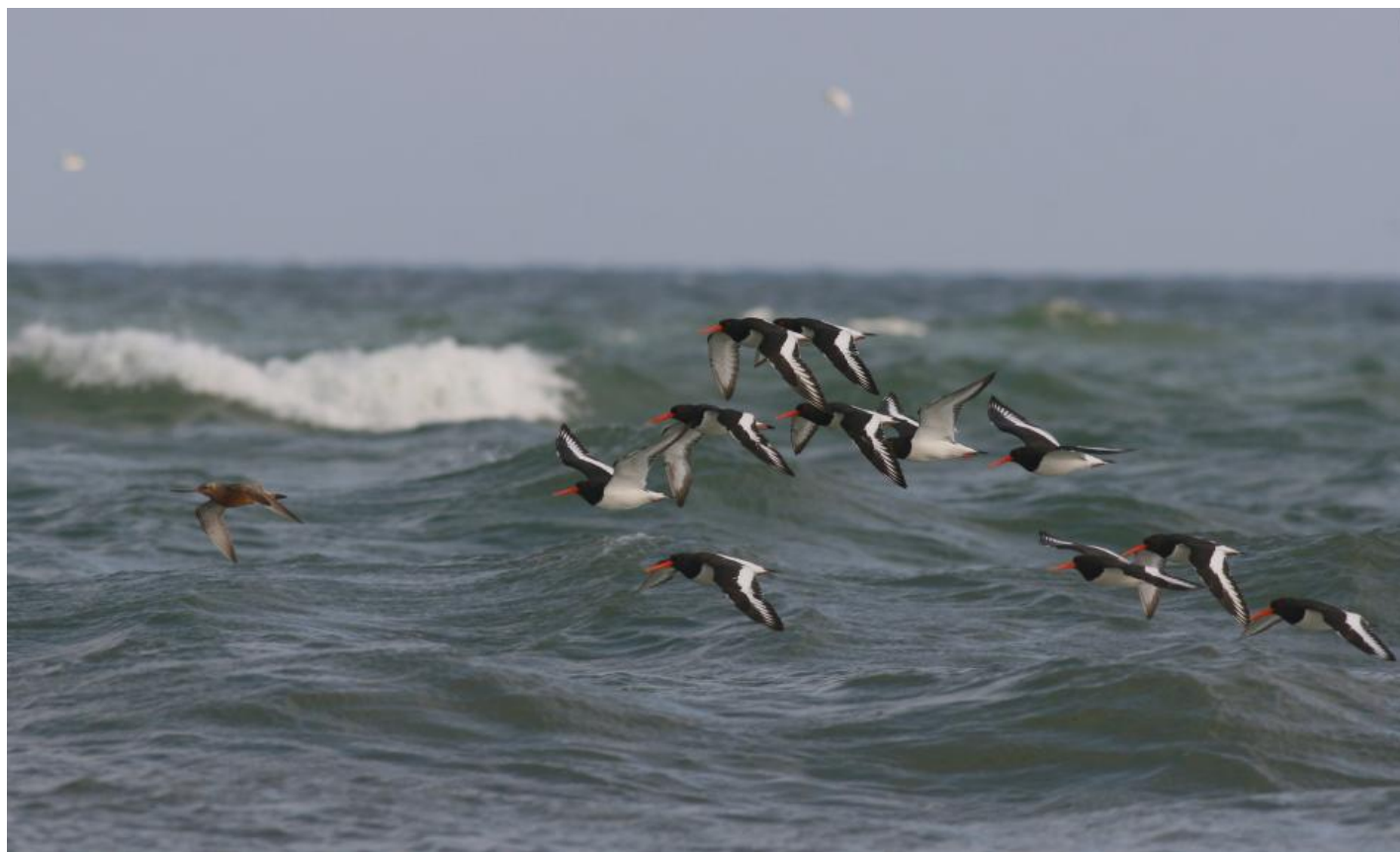
Lille kobbersneppe i selskab med strandskader på træk.