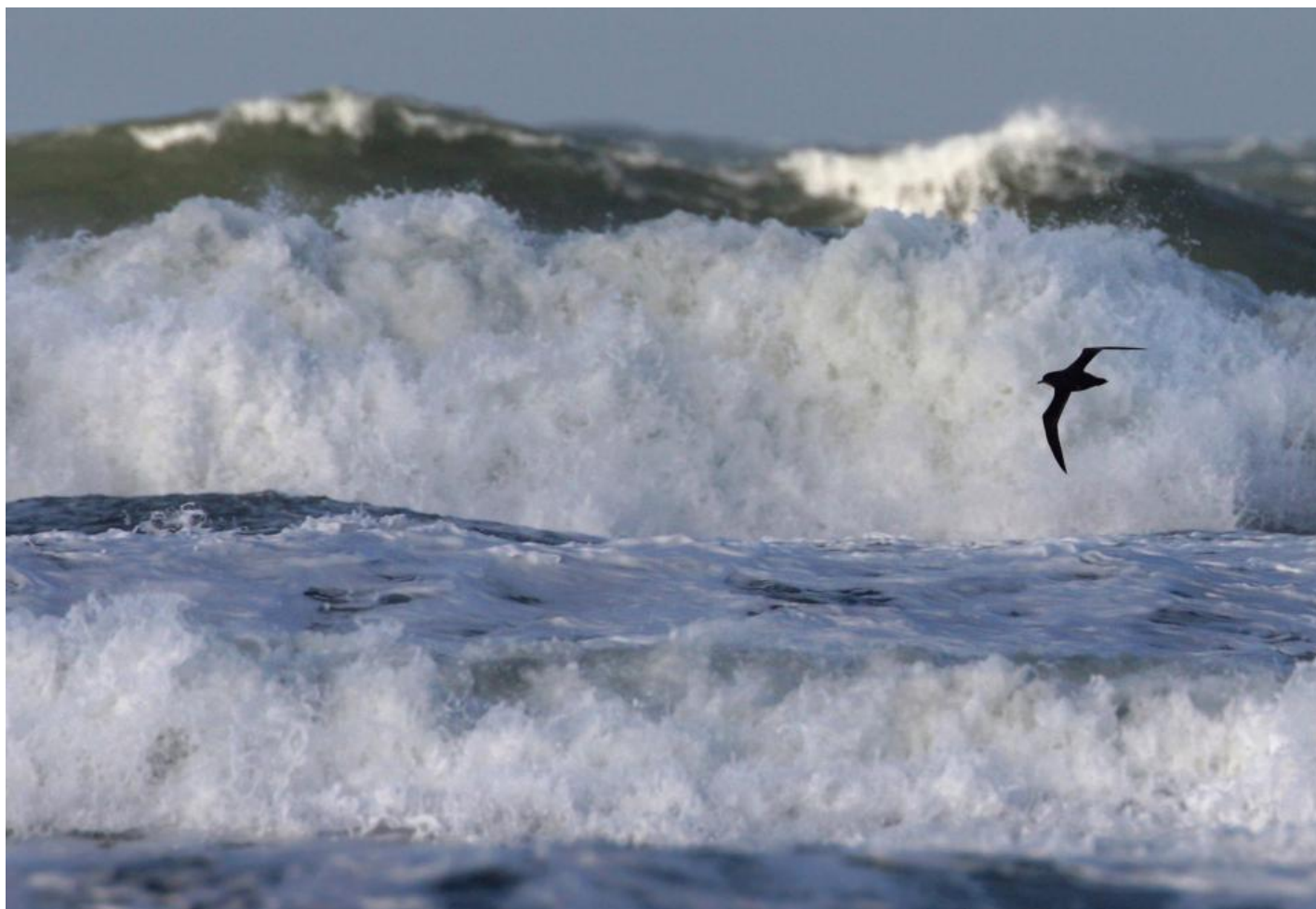
Sodfarvet skråpe i brændingen.