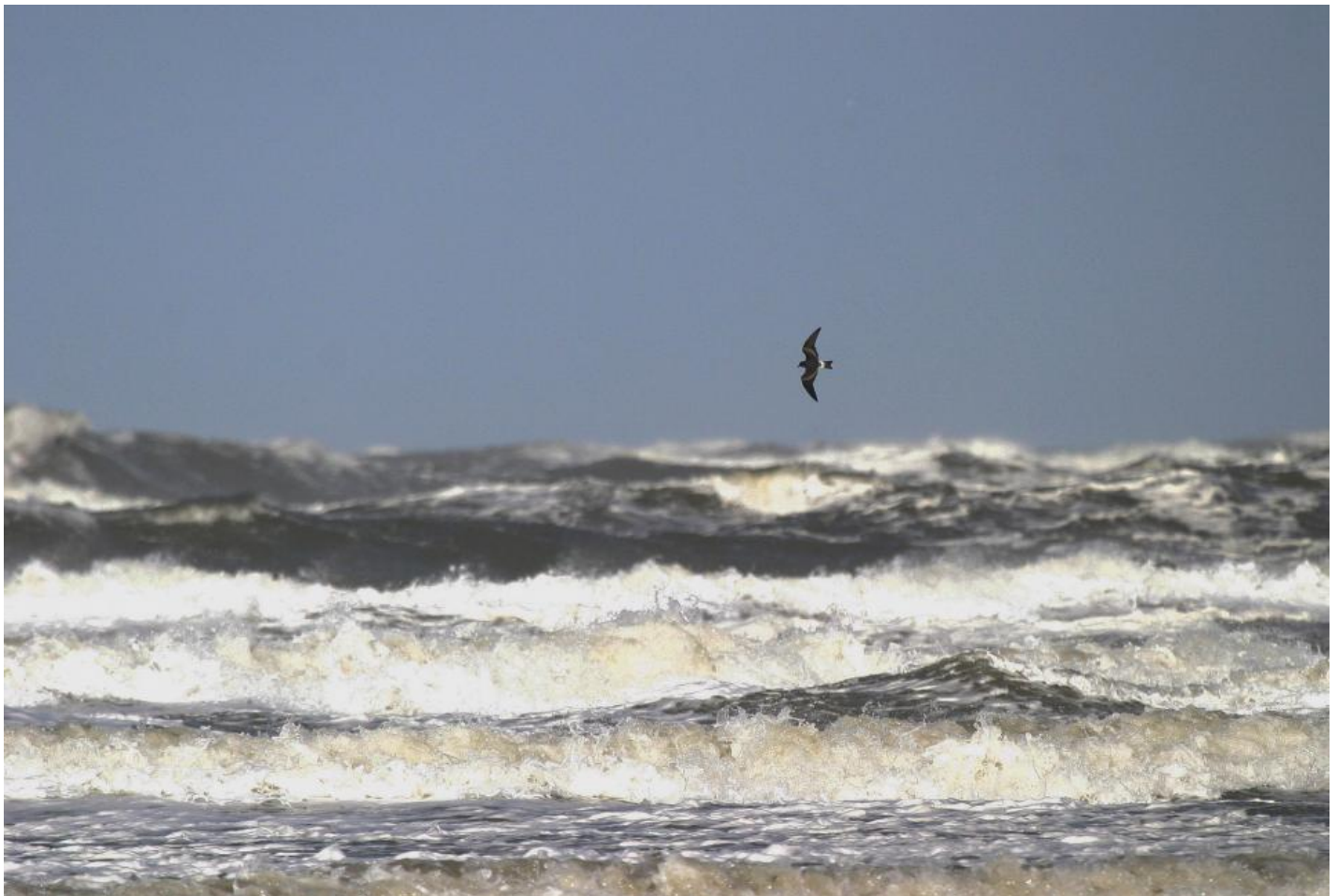
Stor stormsvale med Blåvand om bagbord.

Hans repertoire består stort set dagligt fra april til oktober blandt andet af Langli, Skallingen, klitplantagerne med sine natravne, krondyr og kantareller og naturligvis baghaven på fuglestationen, hvor nettene fanger fugle til ringmærkning i videnskabens og formidlingens tjeneste. Snart vil Fiilsø træde frem på naturscenen og blive en ekstra og kærkommen mulighed for at formidle de vestjyske fuglerigdomme.