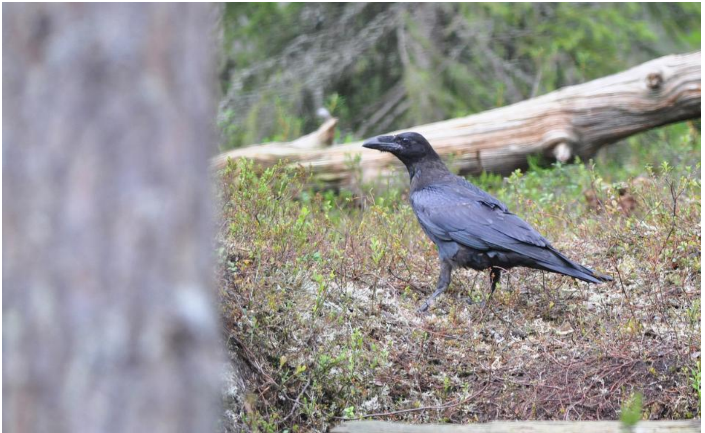
Ung ravn leder efter rester i skovbunden.