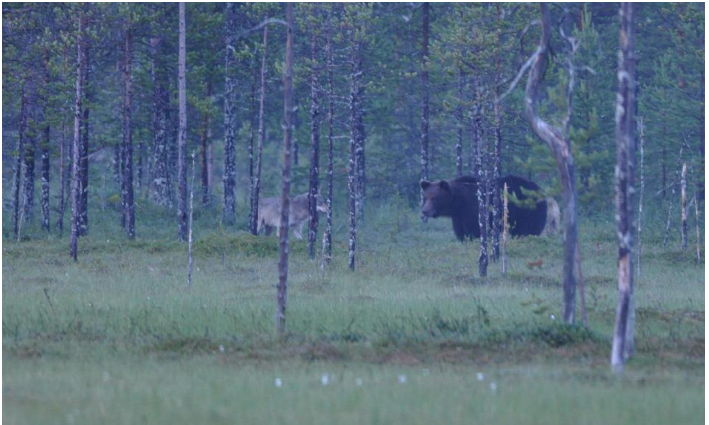
Ulvne gør udfald mod en bjørn i den næsten mørke nat.