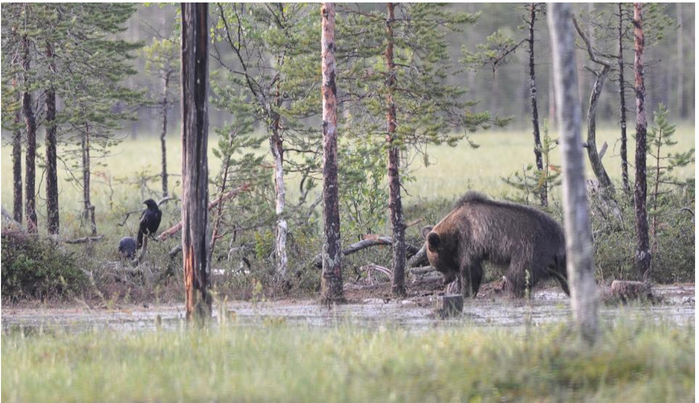
Hunbjørnen er kommet til, mens ravnene er i venteposition.