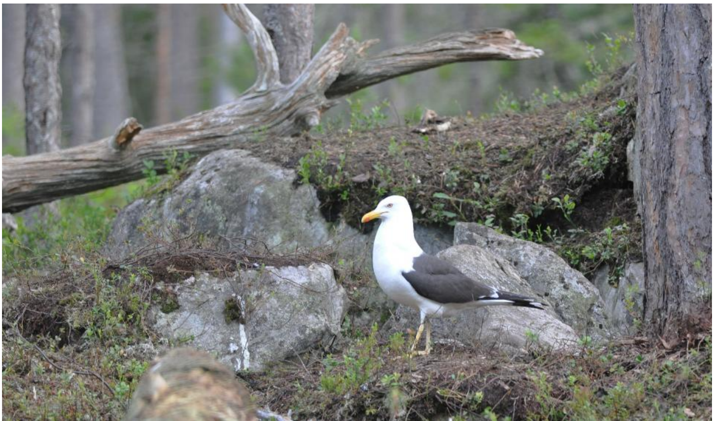
Sildemågen kigger efter laks.