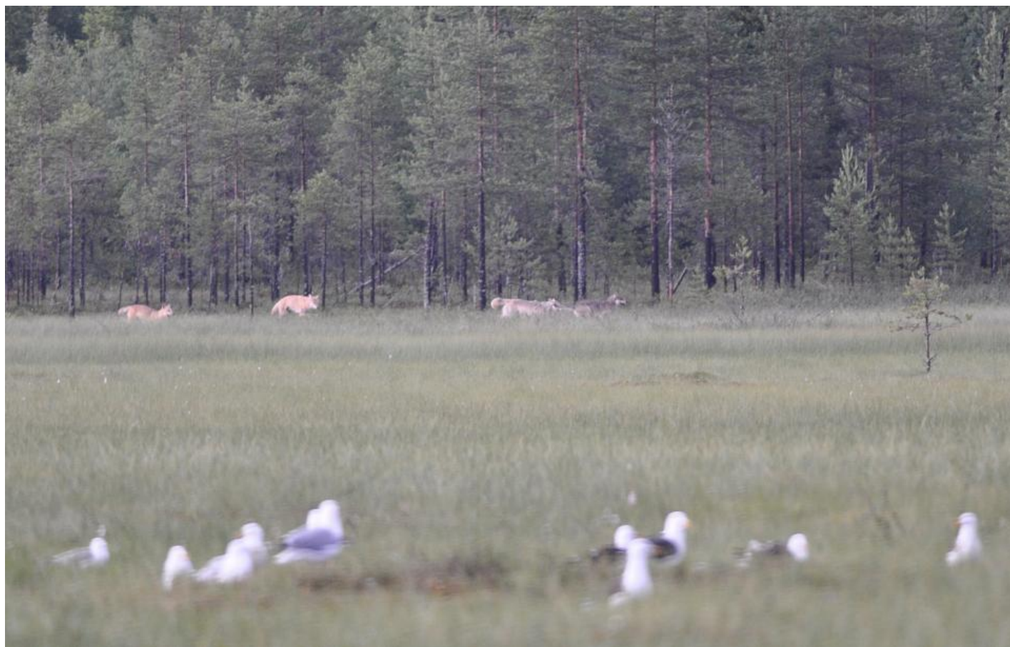
Ulvener kommer løbende ind fra Rusland.