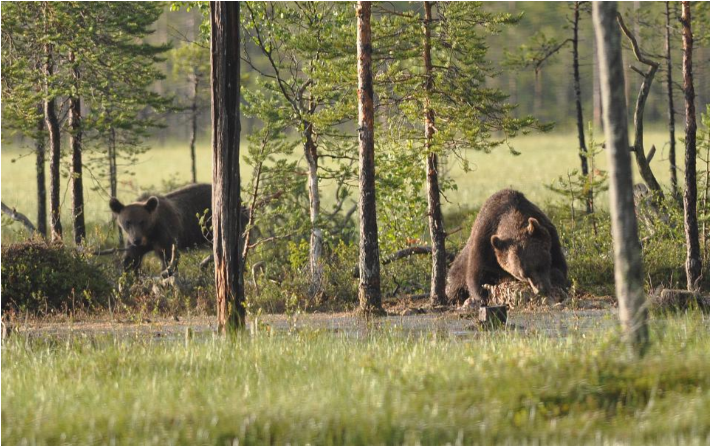
En anden stor hanbjørn æder, mens en hunbjørn klogeligt holder sig på afstand.