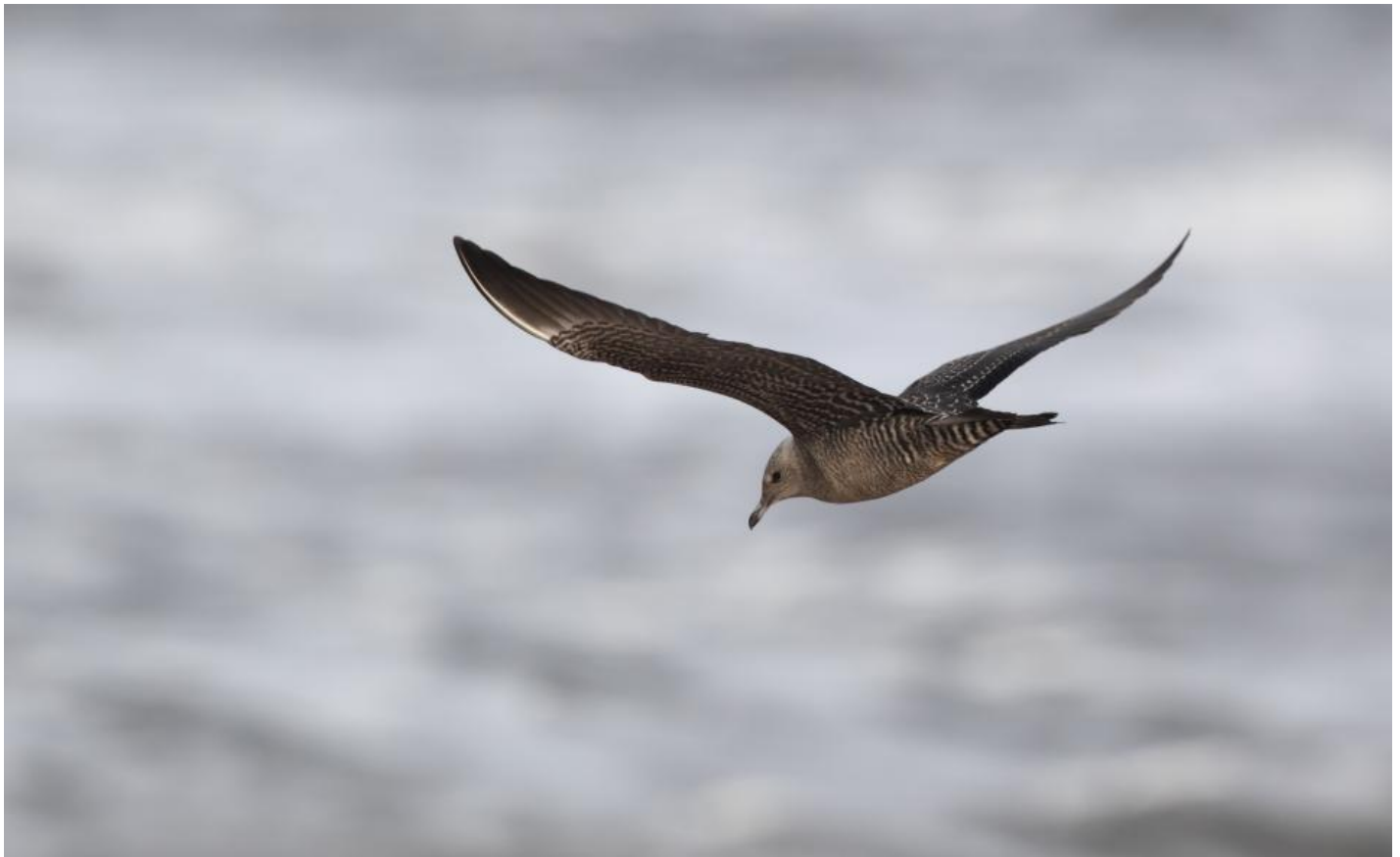
Lille kjoever, Halland den 15. september 2012. Bemærk den tæt sribede undergump samt at den hvide håndrodsplet er lille og ret indistinkt.