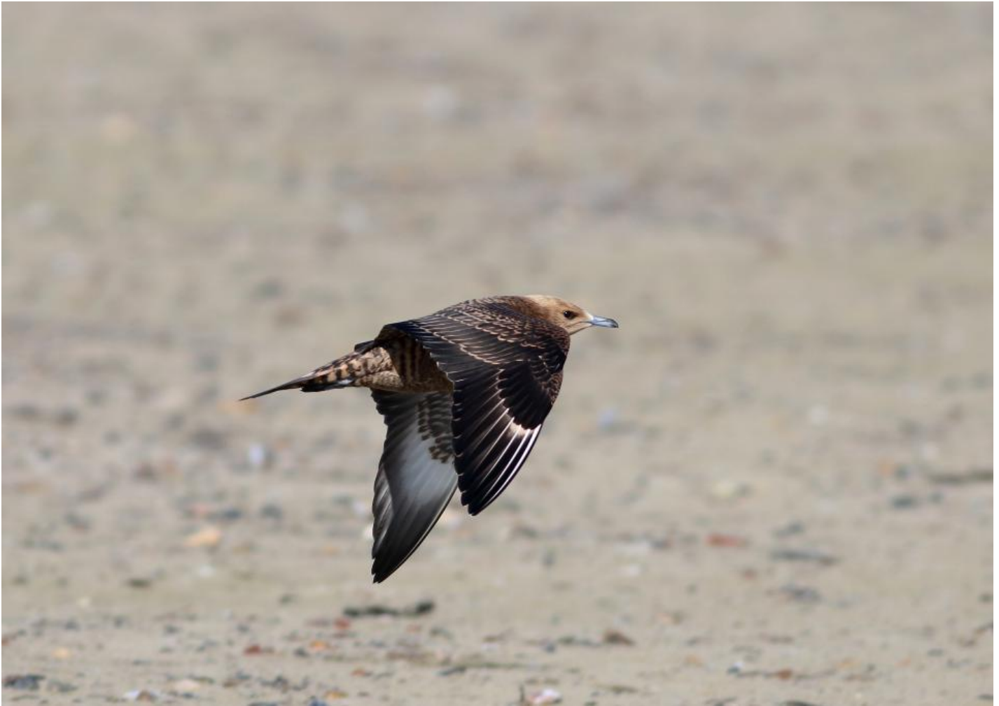
Almindelig kjoeve, samme individ som ovenfor. Bemærk her kombination af lys nakke (hoved) og lys overgump. Overgumpen fremstår ikke distinkt båndet, snarere distinkt plettet. I håndsvingfjerene ses adskillige hvide yderfaner.