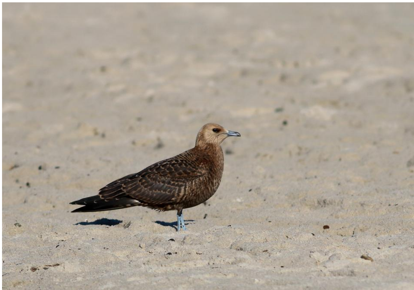
Almindelig kjoever 1K, Grenen den 26. august 2014. Bemærk de varmt brune farver som aldrig vil være at finde på lille kjoever. Bemærk desuden det afstikkende gyldne hoved og at håndsvingfjerene har tydelige gyldne kanter. Sidstnævnte er en karakter, der ikke deles af hverken lille kjoever eller mellemkjoever, der højst viser diffuse kanter.