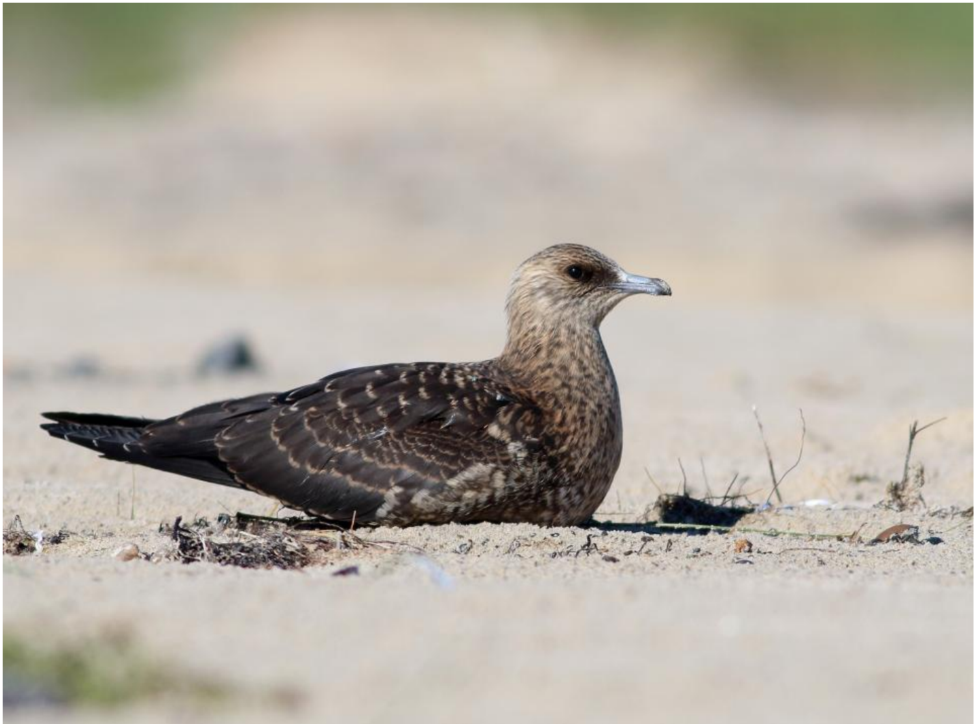
Almindelig kjoeve, Grenen den 26. august 2014. Bemærk afstikkende lys nakke, rustbrune bræmmer på flere dækfjer og de tydelige lyse tegninger i håndsvingfjerens spidser.