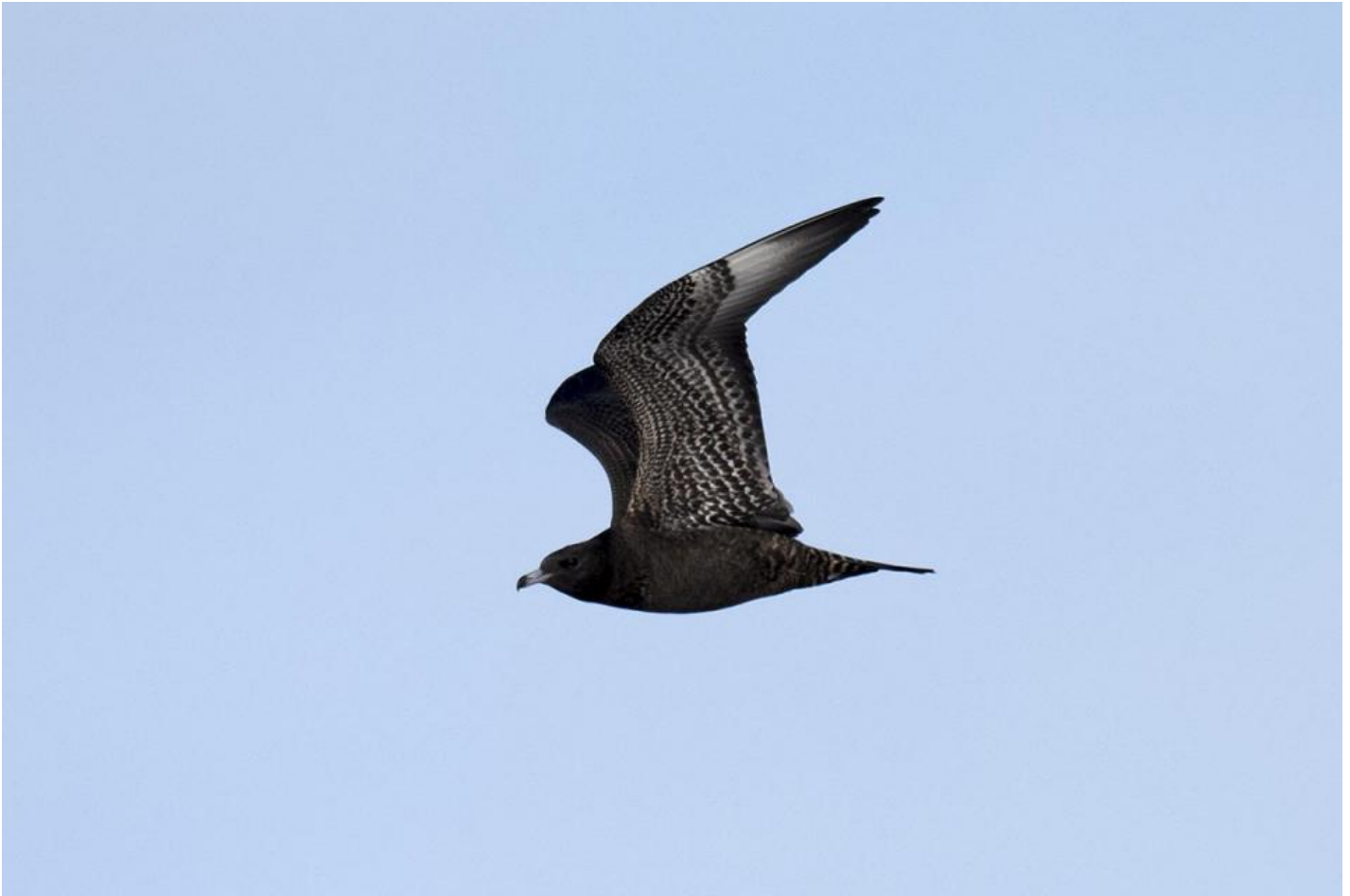
Mellemkjoever, Falsterbo, Sverige den 29. september 2014. Samme individ som ovenfor. Bemærk proportionerne med stort bryst og tyk bug, lange brede vinger, båndet over- og undergump, kontrasterende næb samt den hvide dobbeltplet på undersiden af hånden.