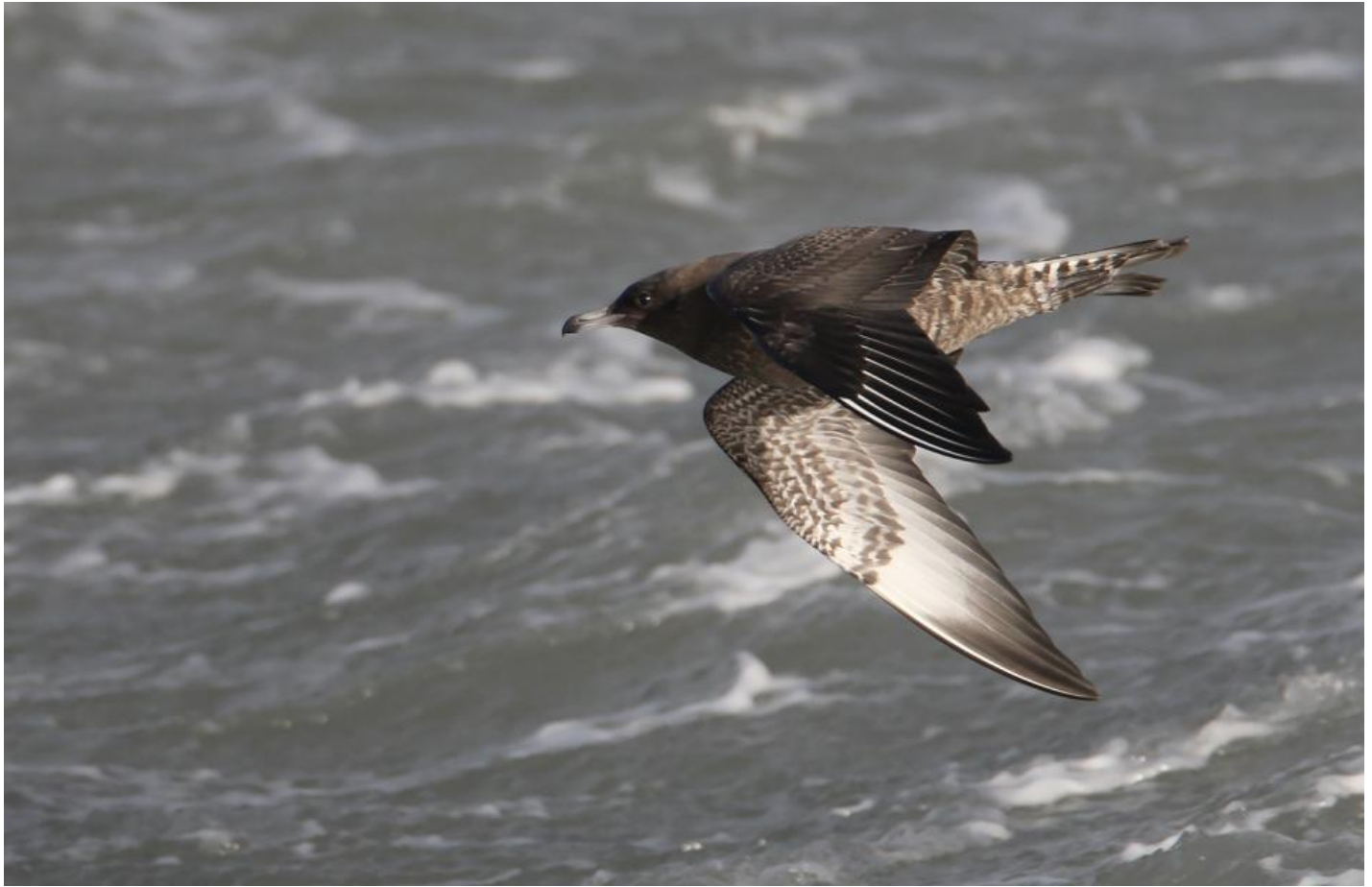
Mellemkjove, Ørhage den 25. november 2007. Samme individ som ovenfor. Bemærk især på dette billede den hvide dobbeltplet i undersiden af hånden.