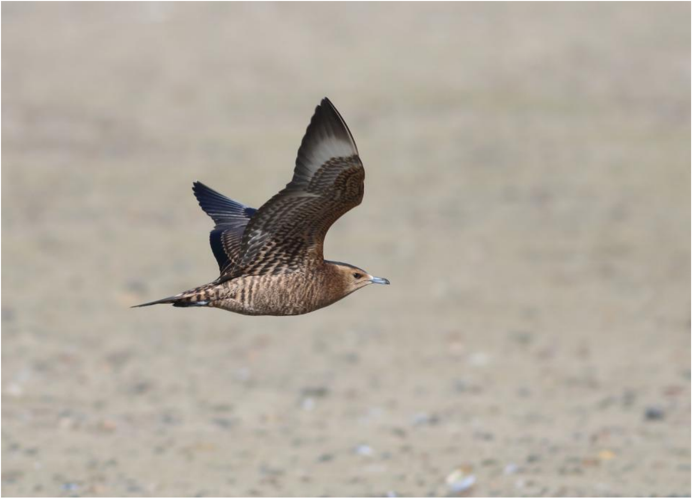
Almindelig kjoever, samme som ovenstående. Bemærk det ret lange hoved og det velproportionerede indtryk af forholdet mellem hoved og haleparti. Desuden bemærkes den ret distinkte hvide håndrodsplet på vingeundersiden.