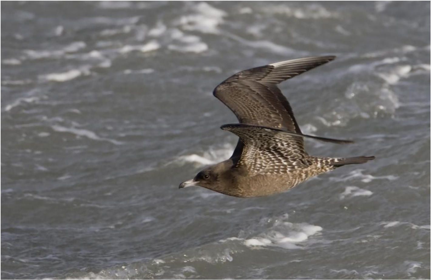
Mellemkjoever, Ørhage den 25. november 2007. Bemærk de kraftige proportioner med stort hoved, bryst og stor mave. Bemærk endvidere det store kontrastfulde næb og den distinkt tegnede over- og undergump. Bemærk det svage lyse felt i nakken. Det skyldes slid og kan ses på mellemkjoever sent på sæsonen.