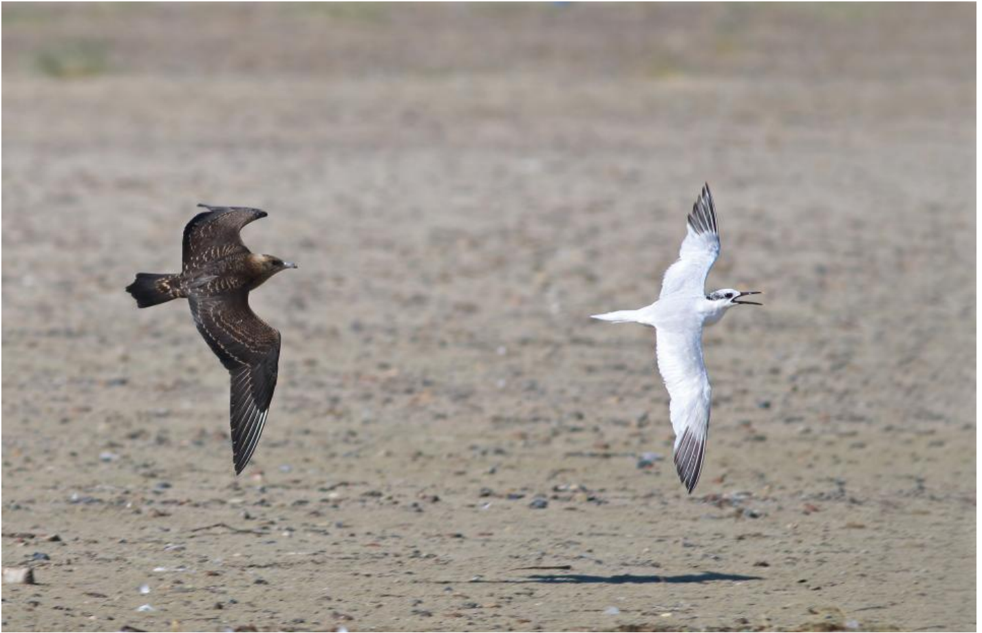
Almindelig kjoever jagende splitterne, Grenen den 26. august 2014. Bemærk de harmoniske og slanke proportioner og sammenlign med lille kjoever og mellemkjoever herunder. Bemærk igen de varme farvetoner og kombinationen af lys nakke og lyst på overgumpen.

Lille kjoever kan opleves i såvel en mørk type, en lys og en mellemtype. Mellemtypen er den mest almindelige. Lille kjoever er slank, korthovedet og langhalet i indtrykket. Hovedet er lille og rundt, og er trykket lidt ind mellem skuldrene sammenlignet med de andre arter. Næbbet er tillige kort, men en stor del af næbspidsen er sort. Faktisk er op mod 40-50% af den yderste del af næbbet sort. Man ser som regel en lys nakke, eller et lysere hoved, i kombination med en lys overgump, og både over- og undergump er tæt- og distinkt stribede. På oversiden af hånden ses at blot to håndsvingfjers yderfaner er hvide, og på undersiden af hånden ses et enkelt hvidt felt i håndroden, ligesom man oplever hos de andre arter, men hos lille kjoever er det ret lille og svagere aftegnet. Lille kjoever har den længste haleforlængelse af de tre arter, og den er stump (afrundet) i form.