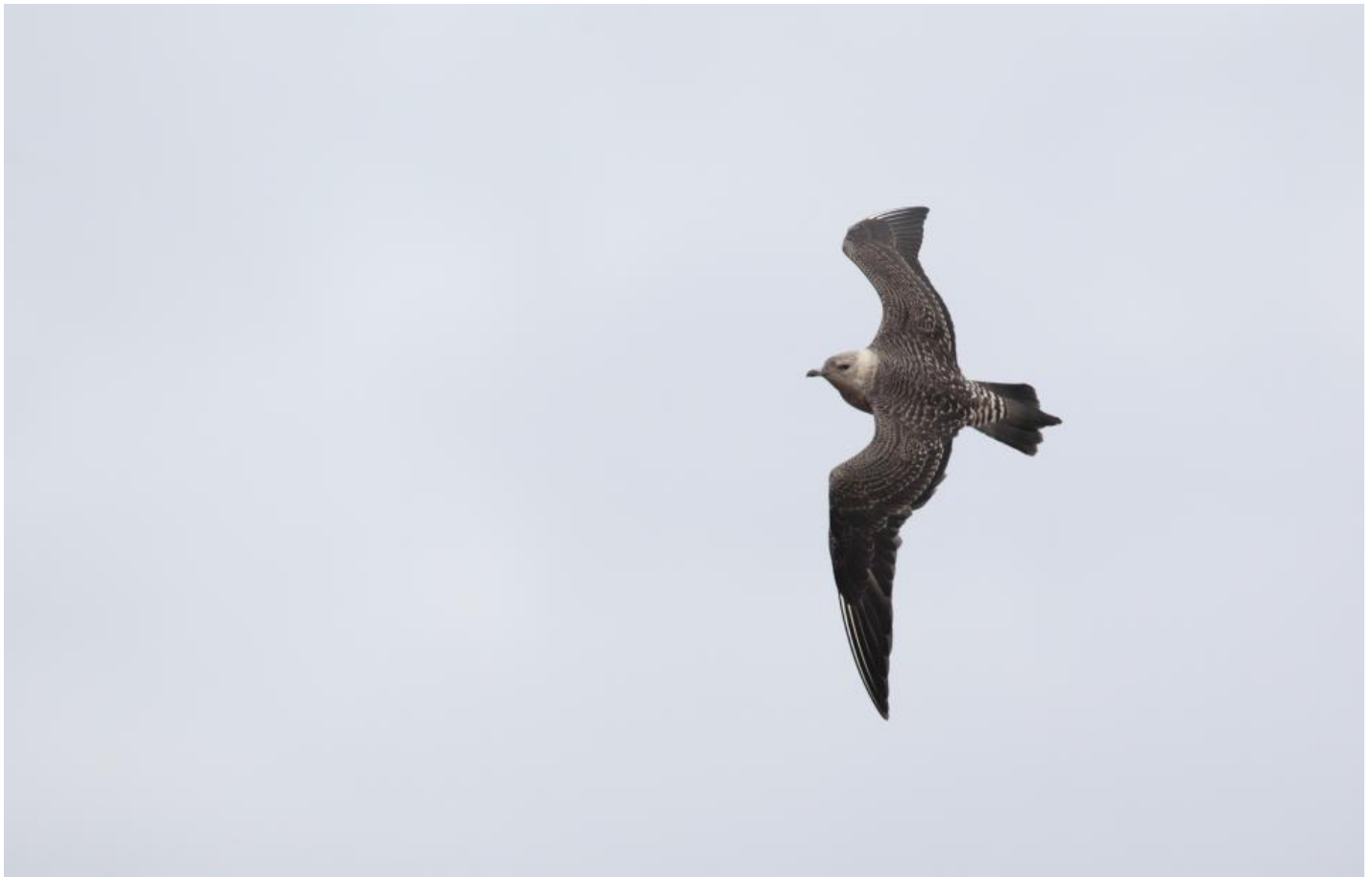
Lille kjoever, Halland den 15. september 2012. Bemærk proportionerne med det korte runde hoved og langt haleparti. Den lyse overgump er distinkt stribet, farvetonerne er kolde og grålige, i hånden ses kun to hvide yderfaner og haleforlængelsen er lang, og ender stump (rundet). Sammenlign især proportioner men også overgumpens tegninger med den almindelige kjoever herover.