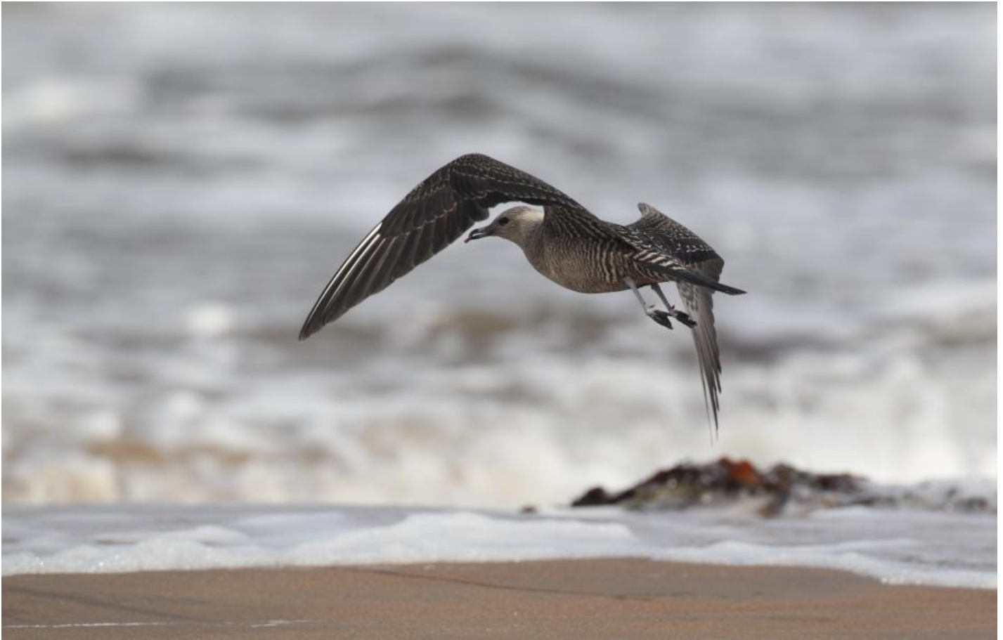
Lille kjoever, Halland den 15. september 2012. Samme fugl som ovenfor. Bemærk de kølige og grålige farvetoner, at både overgump og undergump fremstår distinkt stribede samt de to hvide yderfaner i håndsvingfjerene.