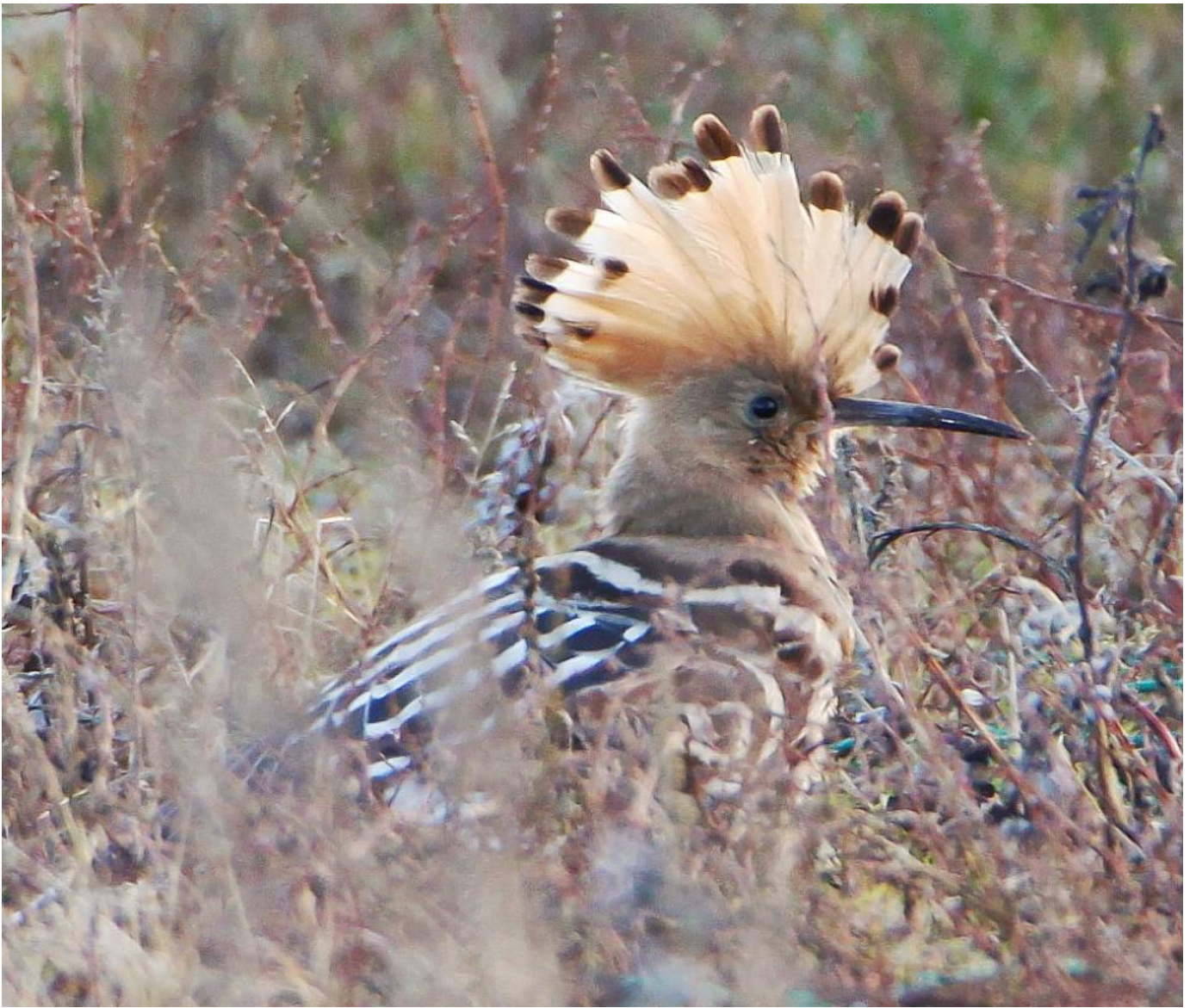
Hærflugt, Reersø Havn den 11. december 2016.

Storpiber havde et fåtalligt efterår i Danmark, men så meget desto mere var det fedt da tre storpibere ved Thorsminde, sås gennem en stor del af december. Samtidig kunne ses en fugl på Grenen i Skagen. Den blev opdaget den 1. december, og blev set indtil den 2. januar. Sidstnævnte er første vinterfund i Skagen. Arten er begyndt at overvintre i Sydeuropa og i Nordafrika.