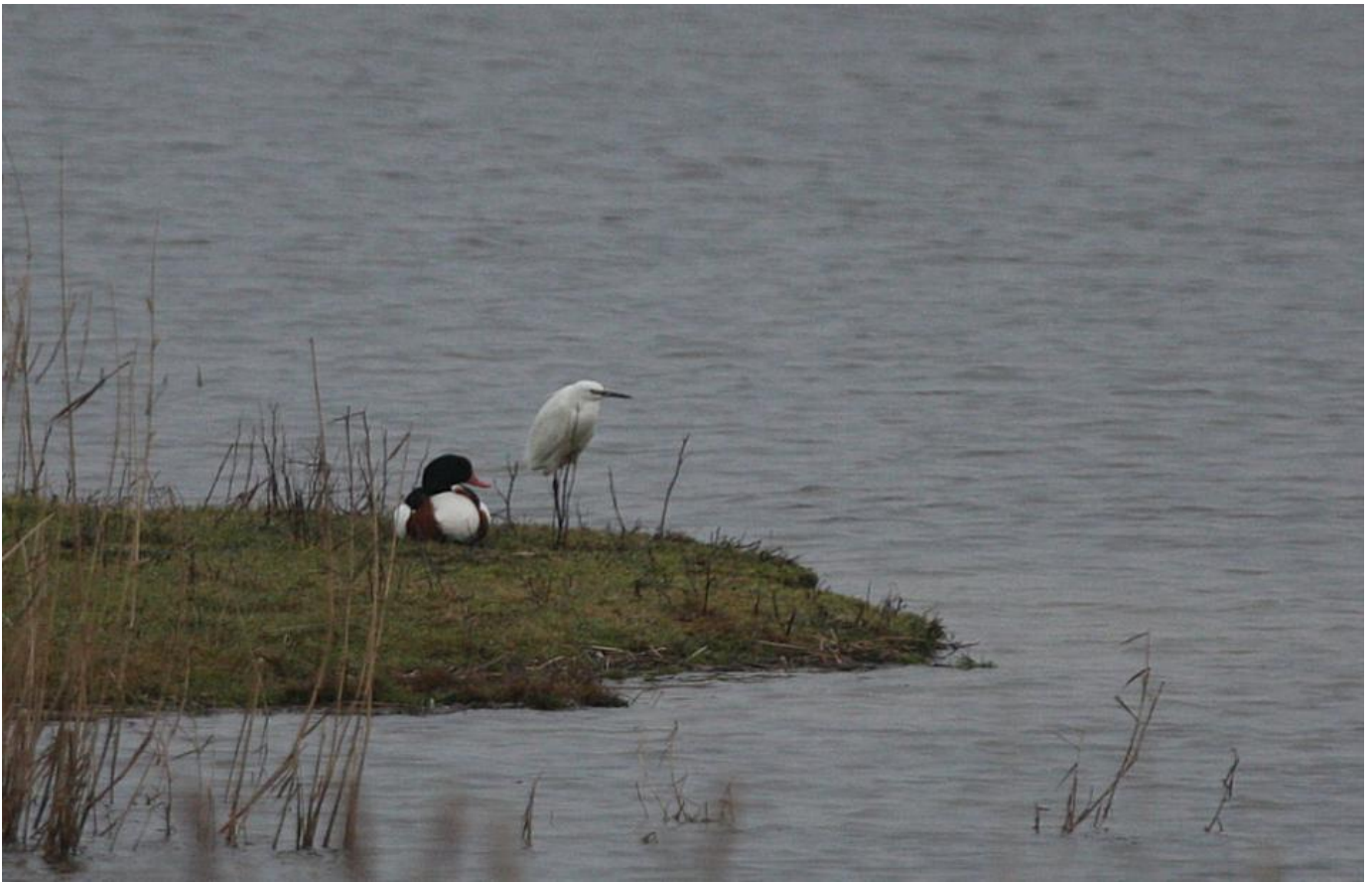
Silkehejre, Attrup Eng sø den 24. januar 2017.

Lidt mere overraskende er det at der også er overvintrende silkehejre på Skjern Enge og i Vadehavet, og så er trane talrig med anslået 70 overvintrende fugle. I december sås et større antal overnattende fugle i Kongens Mose i Sønderjylland. Således 50 den 14. december faldende til 37 den 21. december og derefter ligger det anslåede antal rapporterede fugle på omkring 15 i det sønderjyske område. Lolland (10), Sydsjælland (10) og det Midtjyske (ca. 16) er flot repræsenteret.