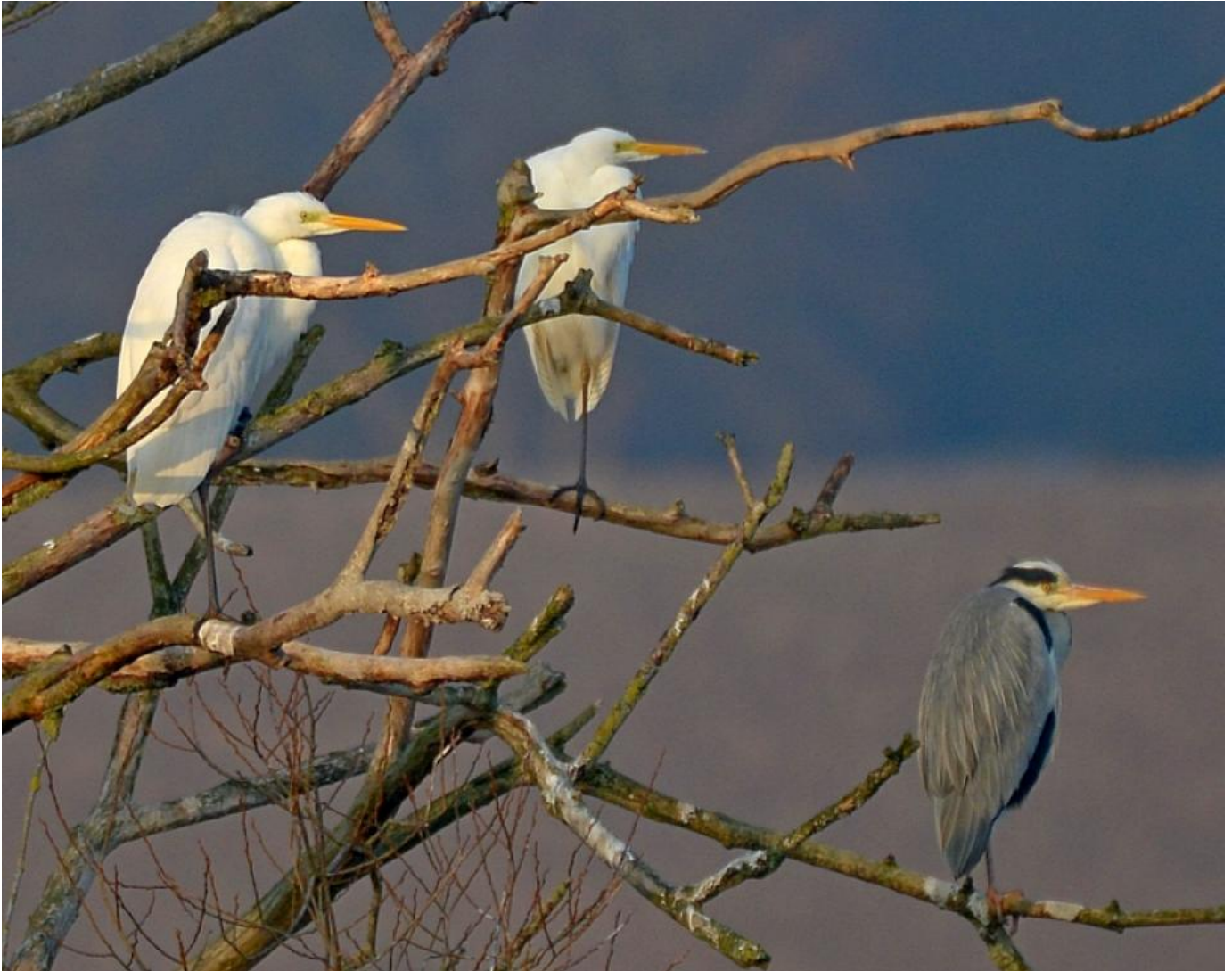
Sølvhejrer (og fiskehejre), Tamosen den 23. januar 2017.

På land er der også sket flere ting, som for få år siden var noget, man ikke kunne forvente. Det mildere klima er slået igennem, og fuglearterne følger med. F.eks. overvintrer der mange sølvhejrer i landet denne vinter. Det fuldstændige overblik mangler jeg, men op til 9 eksemplarer er set på Skjern Enge, 4 i Vejlerne, minimum 4 i Vadehavets Klæggrave samt flere i Sydsjælland.