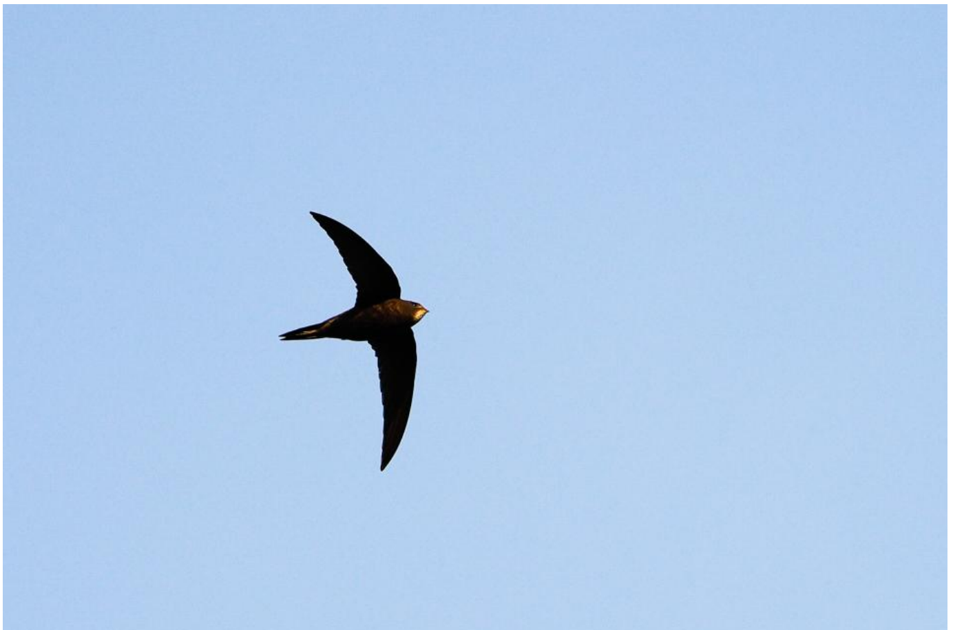
Mursejler, Vesløs Vejle den 8. april 2017. Bemærk lille hoved, lille næb og lille hvid strubeplet.