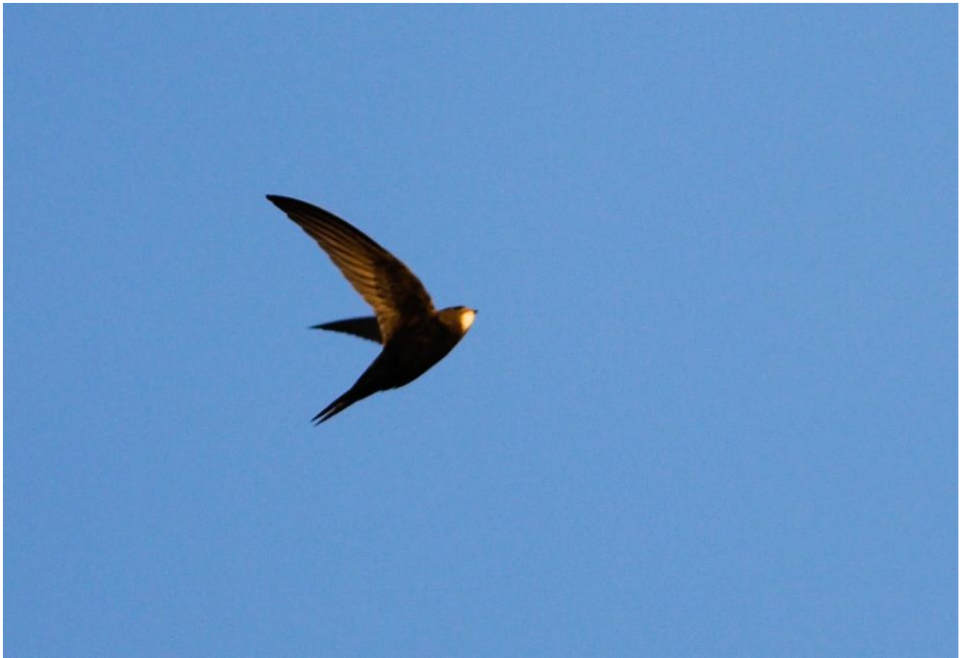
Mursejler, Vesløs Vejle den 8. april 2017. Bemærk meget mørk grundfarve, mørke undervingedækfjer og lille hvid strubeplet.