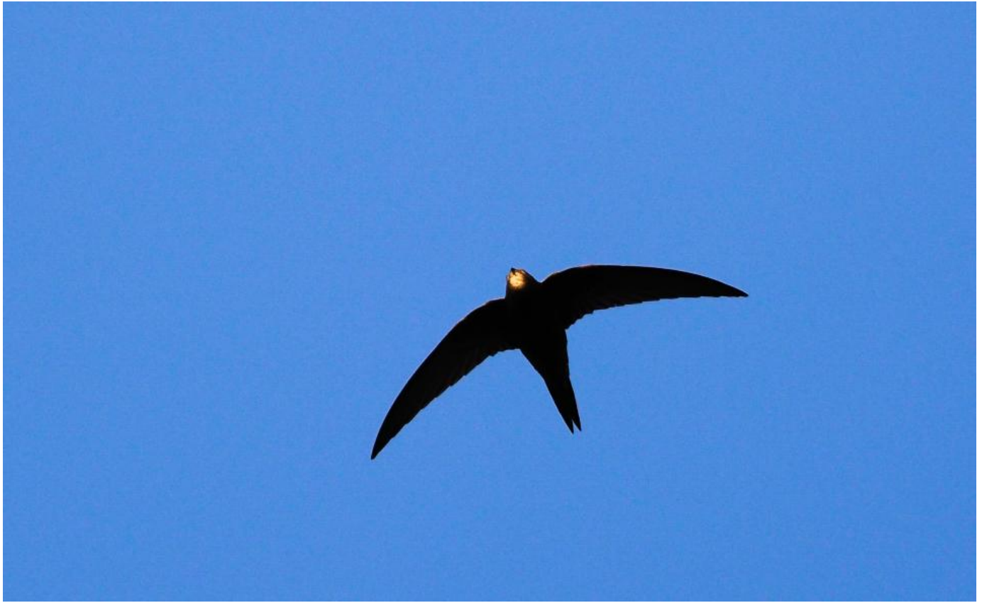
Mursejler, Vesløs Vejle den 8. april 2017. Bemærk den lille hvide hagesmæk, det meget mørke indtryk, det lille hoved og det lille næb.

Hurtigt efter ankomsten møder jeg Helge, som lynhurtigt peger fuglen ud. Fedt.