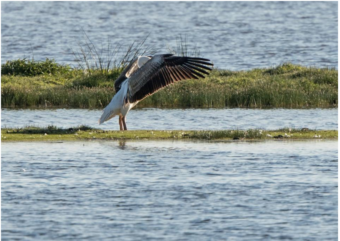
Hvid pelikan, 2K, Fiilsø den 23. juni 2019. Bemærk intakte svingfjer og at der ikke er ringe på benene.

Endelig kom den så at sige ridende på en varmekfront der har sendt temperaturerne op i nærheden af 40 grader i bl.a. Tyskland.