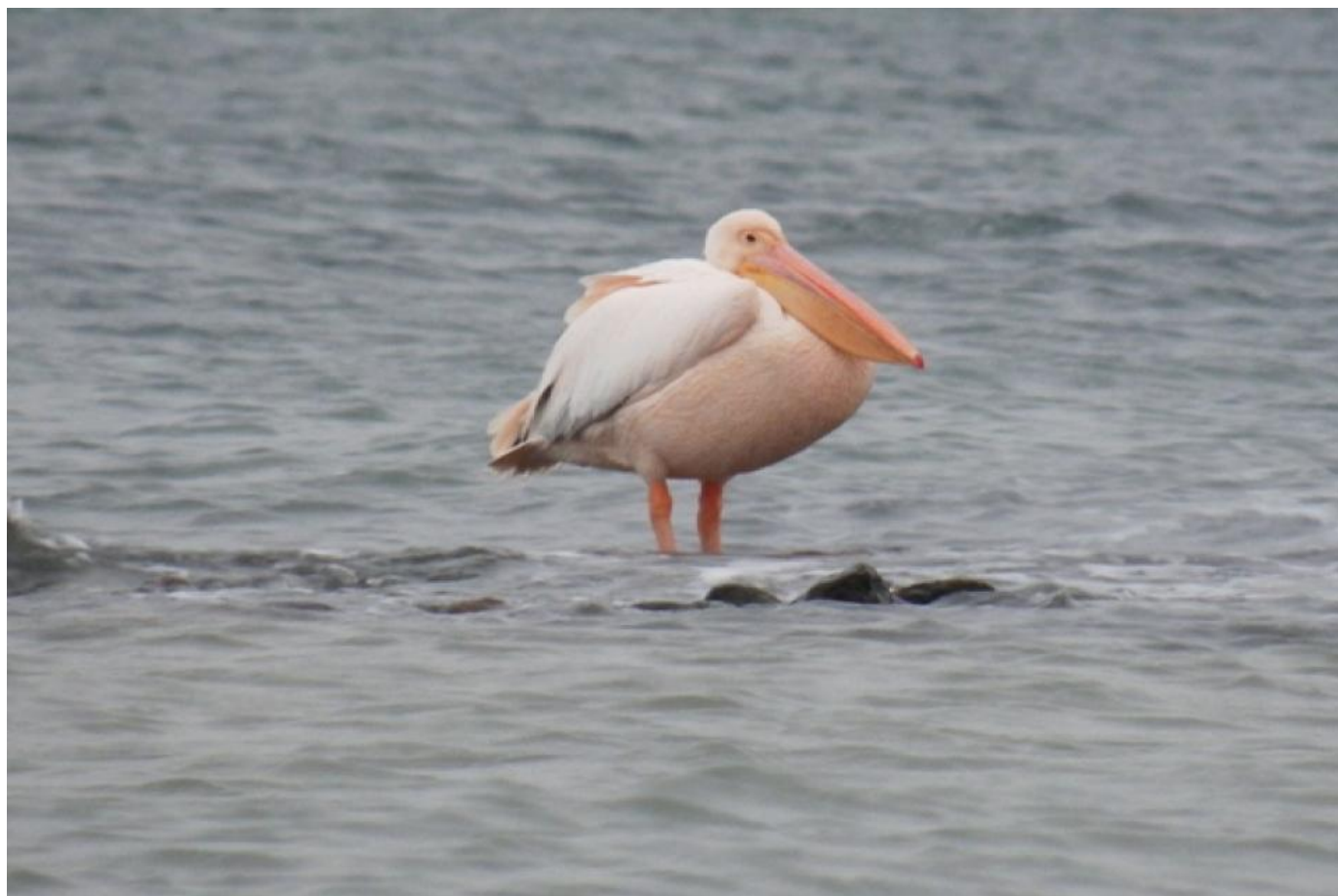
Hvid pelikan, 3K+, Diernæs Strand den 27. december 2013.

hvor den sås i Tyskland. Den blev godkendt i Kategori E (sandsynlige eller sikre fangenskabsfugle) på grund af fuglens adfærd (tillidsfuld) samt forekomsttidspunktet.