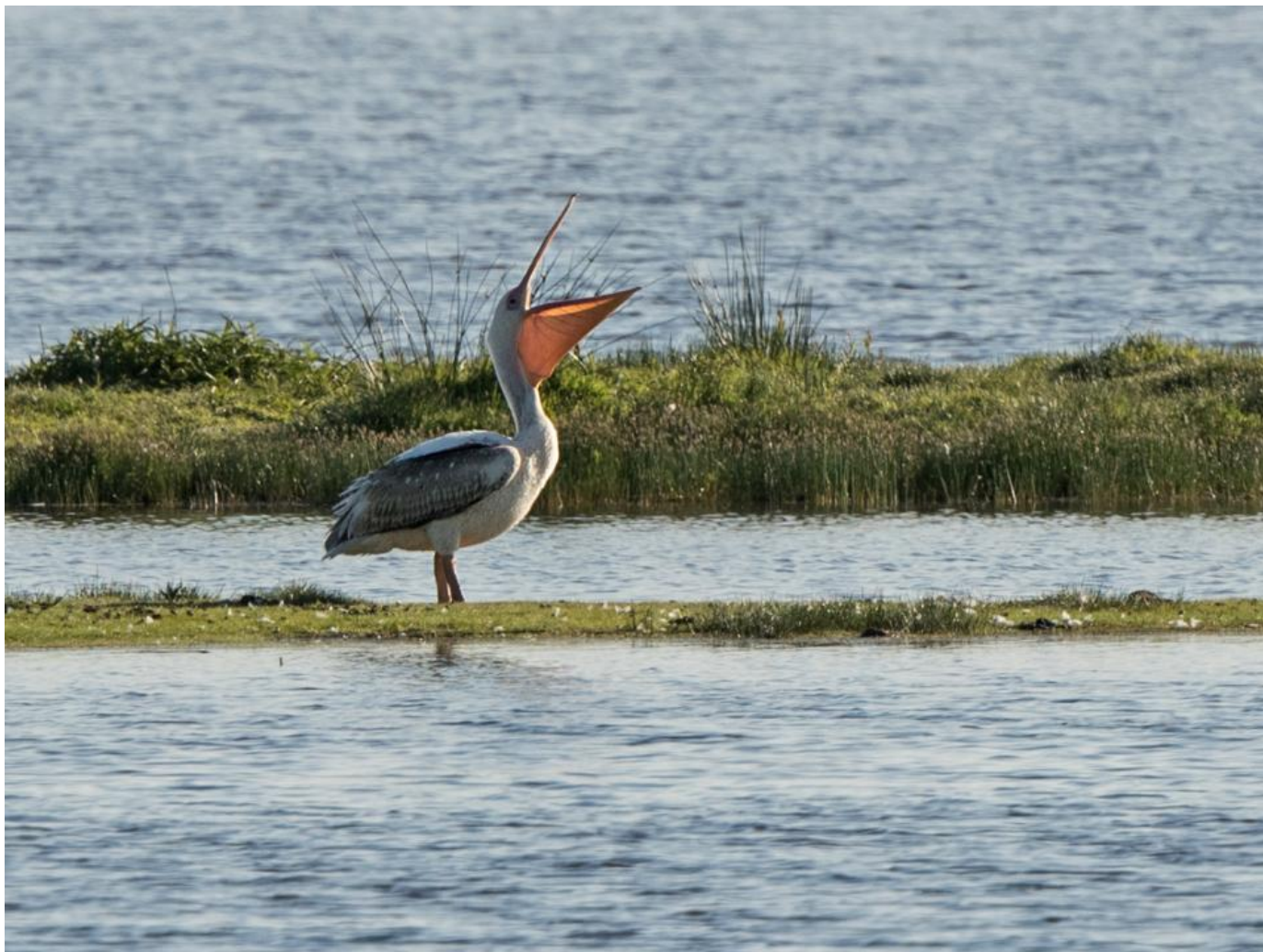
Hvid pelikan, 2K, Fiilsø.

Den aktuelle fugl der først blev set i Fiilsø og siden i Arup Vejle i Vejlerne er nemlig umiddelbart et meget spændende bud på Danmarks første forekomst af en spontan og vild fugl. Dels er der tale om en 2K, altså en ungfugl fra året før. Hos mange fuglearter er det netop de ikke ynglende immature fugle der foretager spredte flyvninger langt uden for artens normale udbredelse. Vi så det f.eks. med flokken på 34 gåsegribbe i 2016, hvoraf de fleste var 2K-fugle.