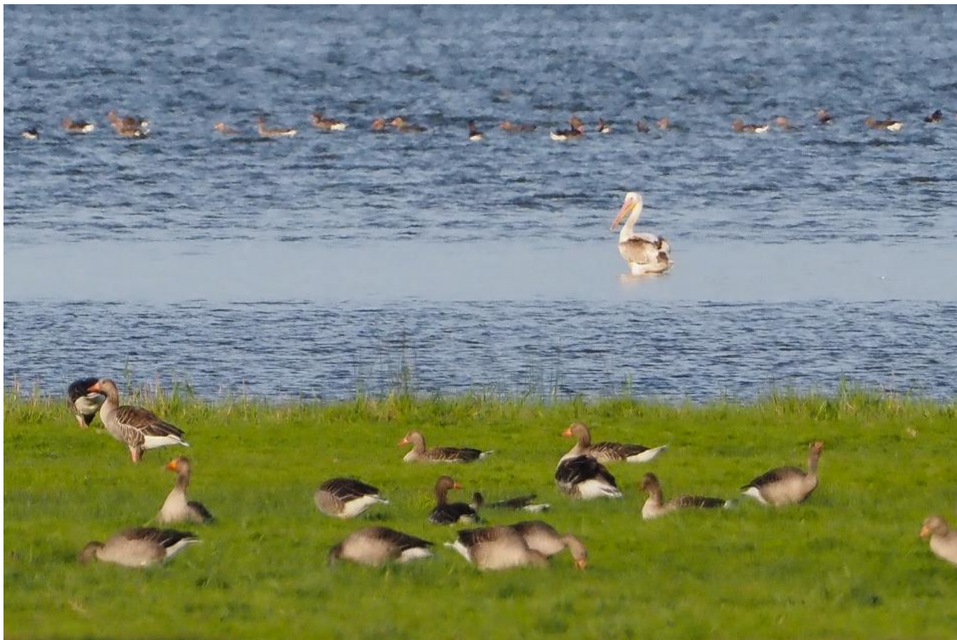
Hvid pelikan, 2K, Arup Vejle den 23. juni 2019.