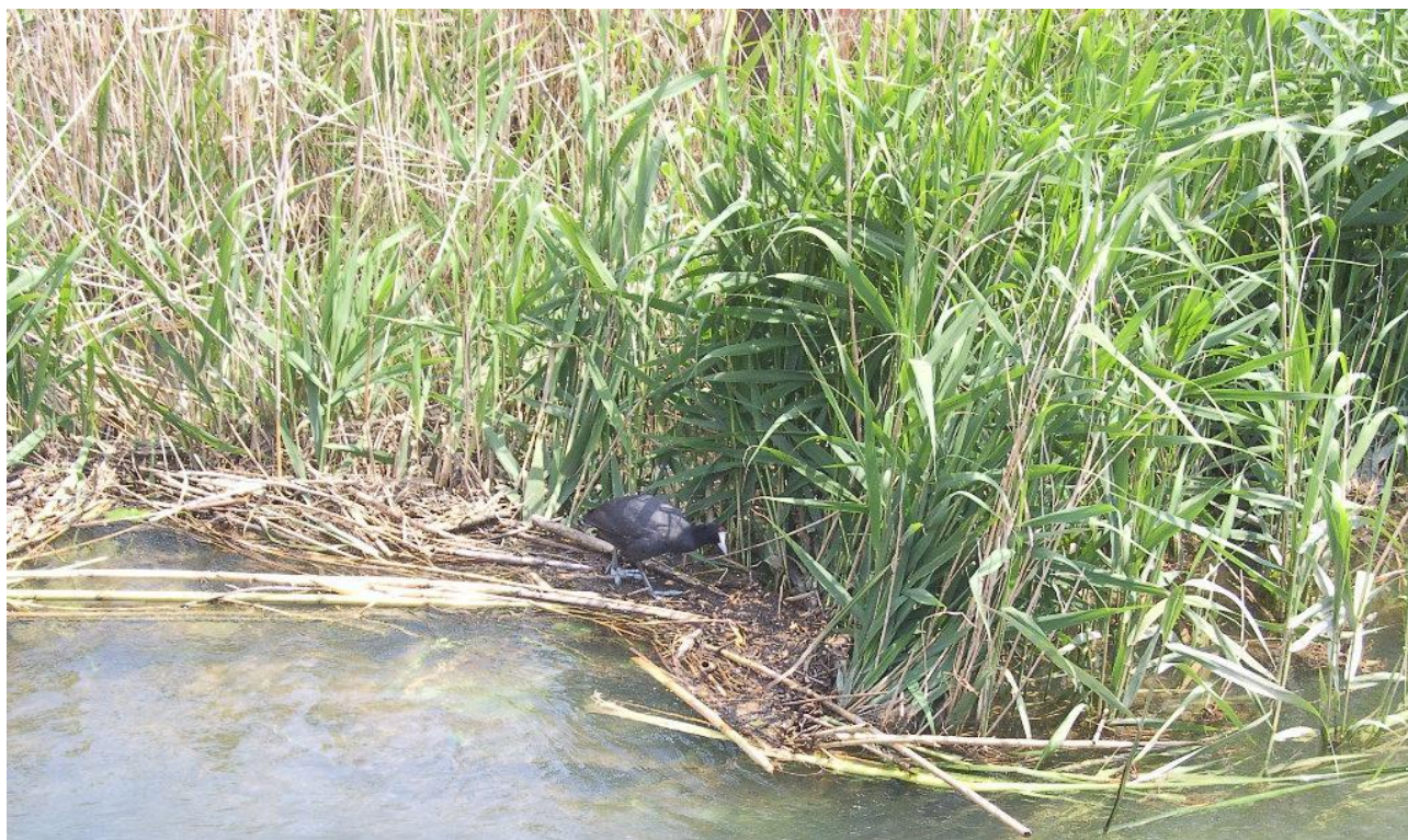
ved S'Albufera

På vejen til Lufthavnen ved byen Inca, et par Rødhøns.