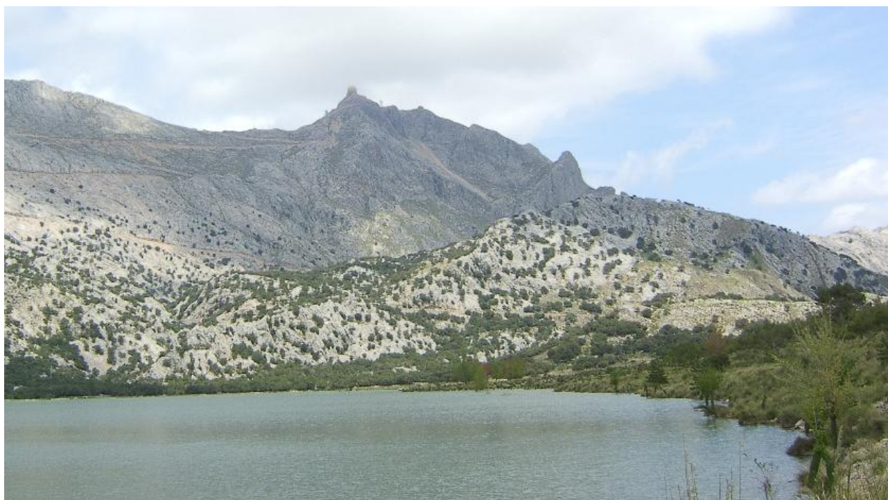
Cuber reservoiret, med Puig Major i baggrunden

Resten af denne dag, stod den på afslapning hjemme på vores altan.