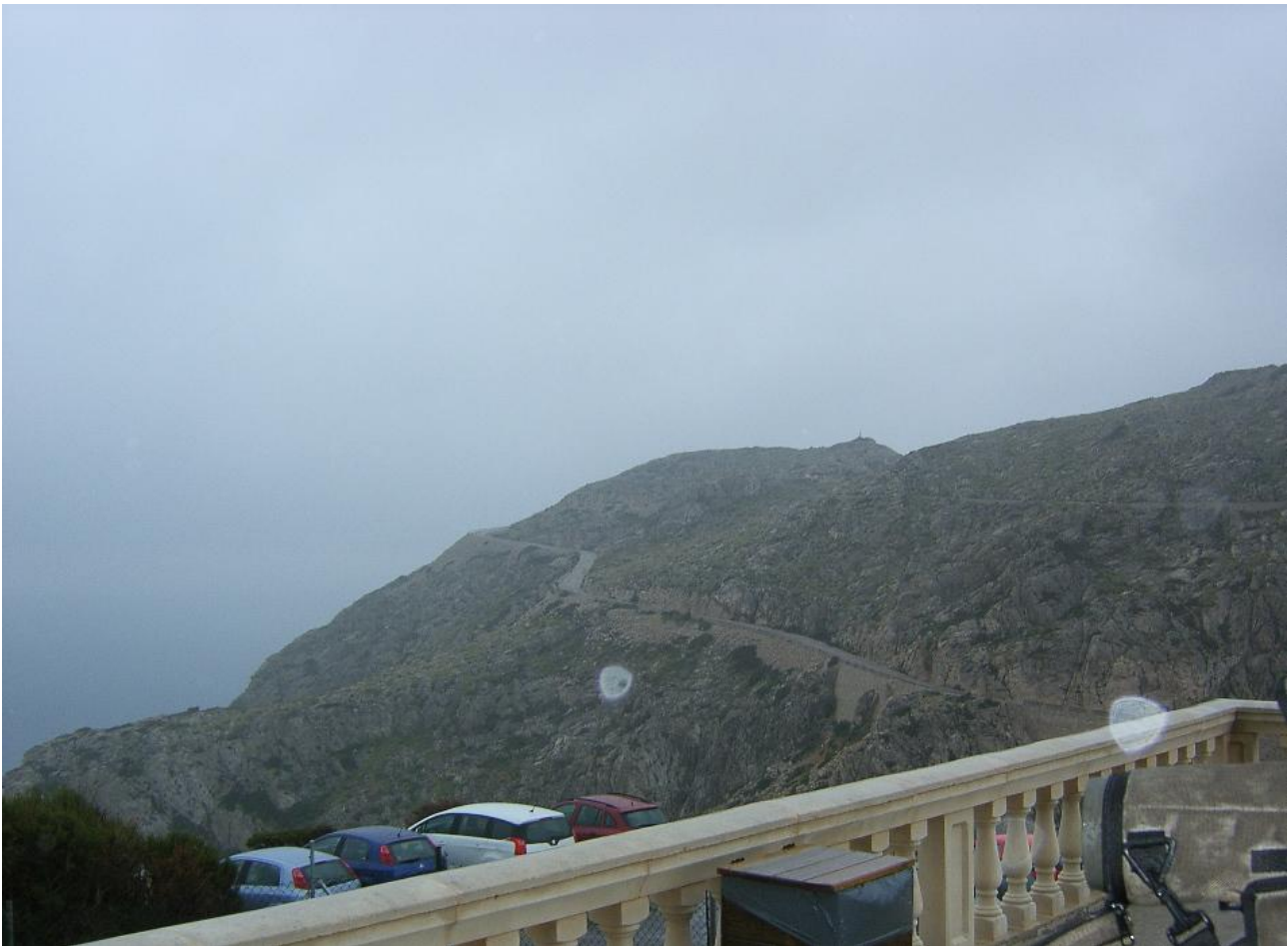
Formentor Bjergene set fra Fyret, udsigten siger alt om hvilket regnvejr det var

Middagsmad kl. 19.00 og ellers mest afslapning denne eftermiddag.